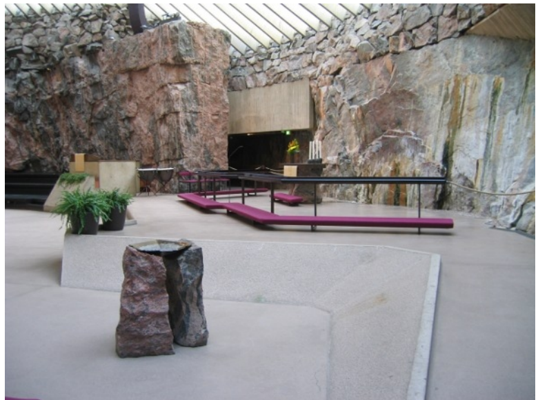
Altari Tempeliaukio kirkjunnar

Við röltum um Esplanade sem eru tvær götur með grónu svæði á milli og rándýrum verslunum beggja vegna. Við borðuðum fiskmeti í tjaldi á markaði við höfnina og kíktum í verslun með vörur eftir frægustu Finnsku arkitektana og