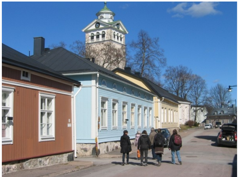
Í Ekenäs, kirkja og húsin í gamla bænum.

Eftir fundinn löbбуðum við að sjónum. Ekenäs er vinsæll sumardvalarstaður í skerjagarðinum og margir koma með báta sína þangað. Veðrið var gott, talsverð gola af suðvestri við sjóinn en mun lygnara inni í bænum. Hitinn um 10 stig. Sólin skein allan daginn og gott að koma út í hádeginu þegar við löbбуðum í 5 mínútur til að fara í hádegismat.