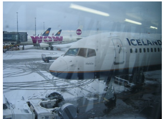
Snjór á Keflavík við brottför.

Finnlands en fara til Stokkhólms. Ástæða þess er að í apríl flýgur Icelandair ekki alla daga beint milli Keflavíkur og Helsinki. Við þurftum hvort sem er að millilenda á leiðinni til baka ef