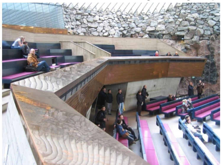
Svalirnar í Tempeliaukio kirkjunni.