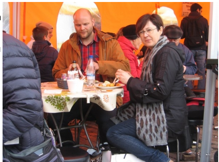
Fengum okkur í svanginn í tjaldi á markaði í Helsinki.

Merki Axxell skólans sést á nýlegri byggingu þeirra.